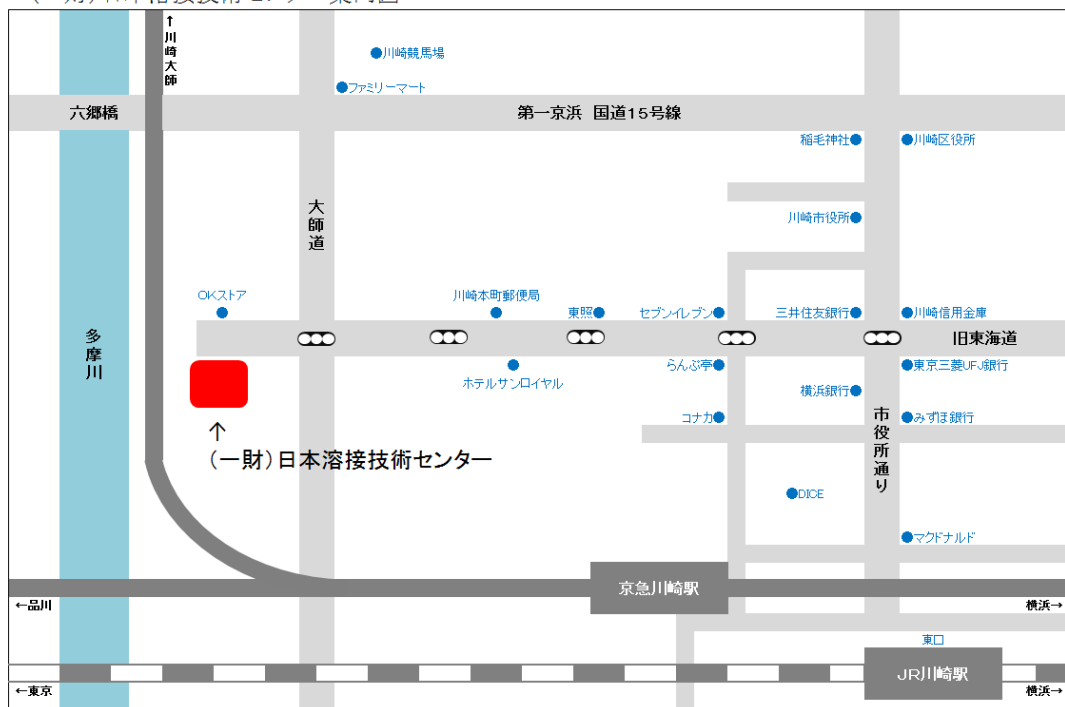
(一財)日本溶接技術センター案内図

※駐車場はありません。JR・京急をご利用ください。JR川崎駅東口より徒歩15分。京急川崎駅より徒歩10分。